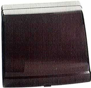
• Vanne 8500 SE • 8500 SE valve