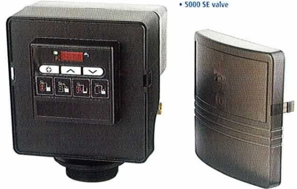
• Vanne 5000 avec Programmateur SE • 5000 SE valve